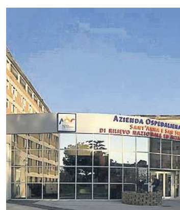
IL PRESIDIO Nuovo ambulatorio

fragile e deve essere supportato nella gestione della stomia, nella prevenzione e cura delle possibili complicanze. L'ambulatorio che abbiamo attivato nel presidio di Caserta - sottolinea il direttore dell'uo di Chirurgia dei Grossi Traumi - viaggia in questa direzione: prendersi cura della persona stomizzata, personalizzando e umanizzando il percorso terapeutico con il coinvolgimento del nucleo familiare».